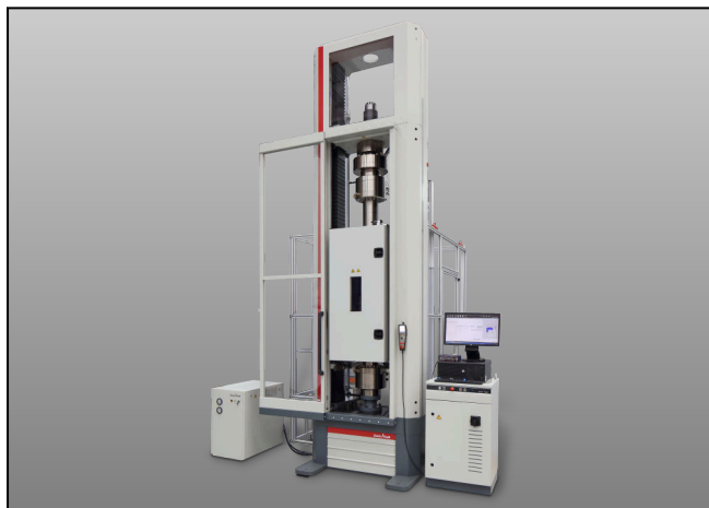
Z600E mit geschlossener Temperierkammer