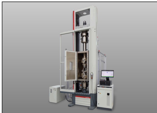
Z600E mit geöffneter Temperierkammer